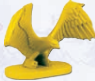
Adler 5 Bataillone